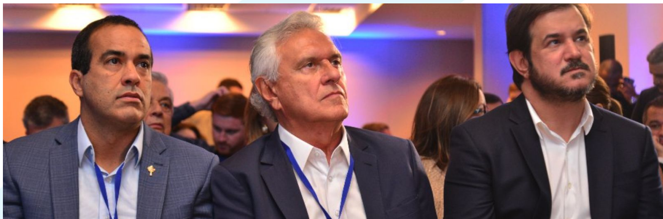
Bruno Reis, prefeito de Salvador; Ronaldo Caiado, governador de Goiás; e Antônio de Rueda, presidente do União Brasil

No dia 6 de novembro, os prefeitos aprenderam principalmente sobre o cuidado com as contas públicas. Grandes nomes da gestão, administração financeira e tributária discorreram sobre diversos aspectos das prefeituras. Especialistas da Consultoria Nossas Ideias explicaram como executar um bom planejamento durante os quatro anos de mandato. Além disso, os políticos receberam um extenso material, físico e digital, com sugestões de decretos e ações para o primeiro dia de mandato.