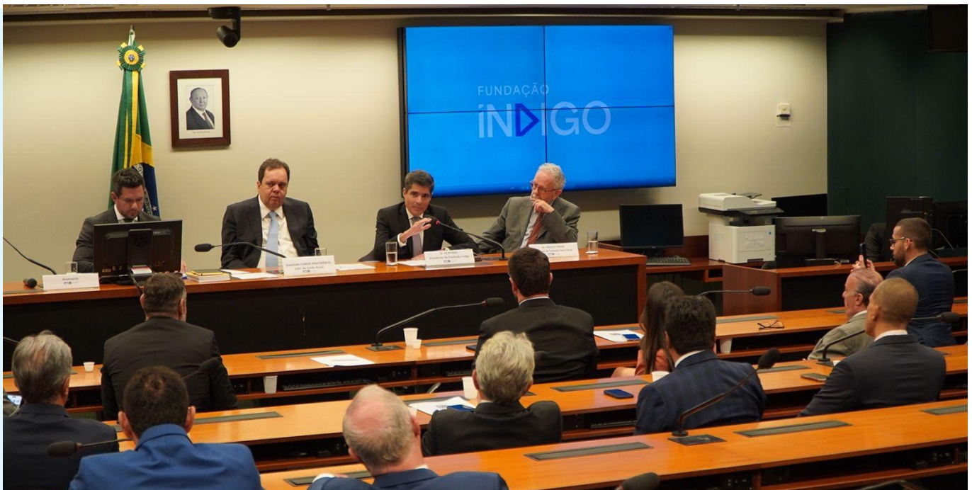
ACM Neto participa da reunião da bancada do União Brasil na Câmara dos Deputados

Com foco nas eleições municipais, lançamos, em abril, na Câmara dos Deputados, um dos nossos projetos prioritários: o Formação de Candidatos. Em parceria com a Fundação Dom Cabral, a melhor escola de negócios da América Latina, o curso capacitou 82 candidatos a prefeito; 26 candidatos a vice-prefeito; 178 candidatos a vereador e 182 assessores . Os nossos alunos contribuíram para os bons números do União Brasil no pleito de 2024: 584 prefeitos, 503 vice-prefeitos e 5.495 vereadores.