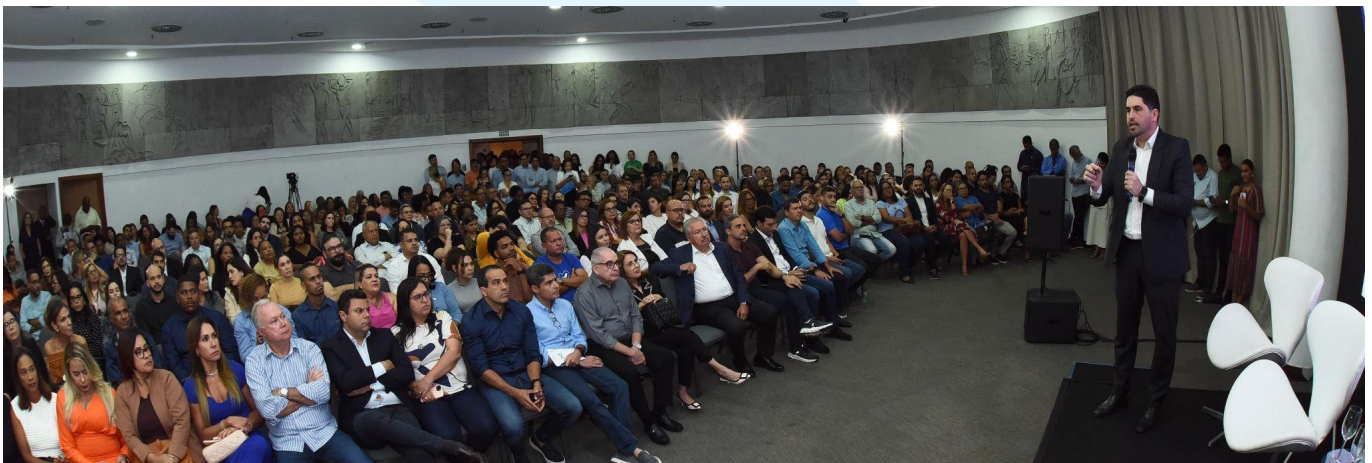
Lançamento do curso Melhores do Brasil, em Salvador (BA), com palestras sobre gestão pública

Cumprindo uma de nossas missões, que é revelar novos quadros para a política, realizamos o melhor curso de formação de jovens lideranças, em parceria com o Ibmecc, a partir de maio. Foram mais de dois mil inscritos de todas as regiões do Brasil, que passaram por rigoroso processo seletivo para chegar aos 371 selecionados. Os alunos tiveram 120 horas/aula sobre conhecimentos aplicáveis à política e à gestão pública. Ao final do curso, apresentaram projetos com base em suas realidades para chegarem à nota final.