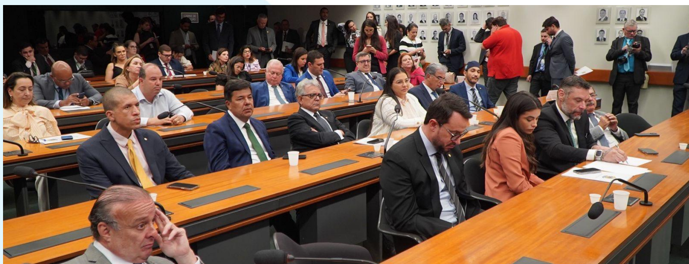
Lançamento durante reunião da bancada de deputados federais do União Brasil

Os alunos formados pelo Formação de Candidatos contribuíram para os bons números do União Brasil nas eleições municipais de 2024, quando foram eleitos 584 prefeitos, 503 vice-prefeitos e 5.495 vereadores.