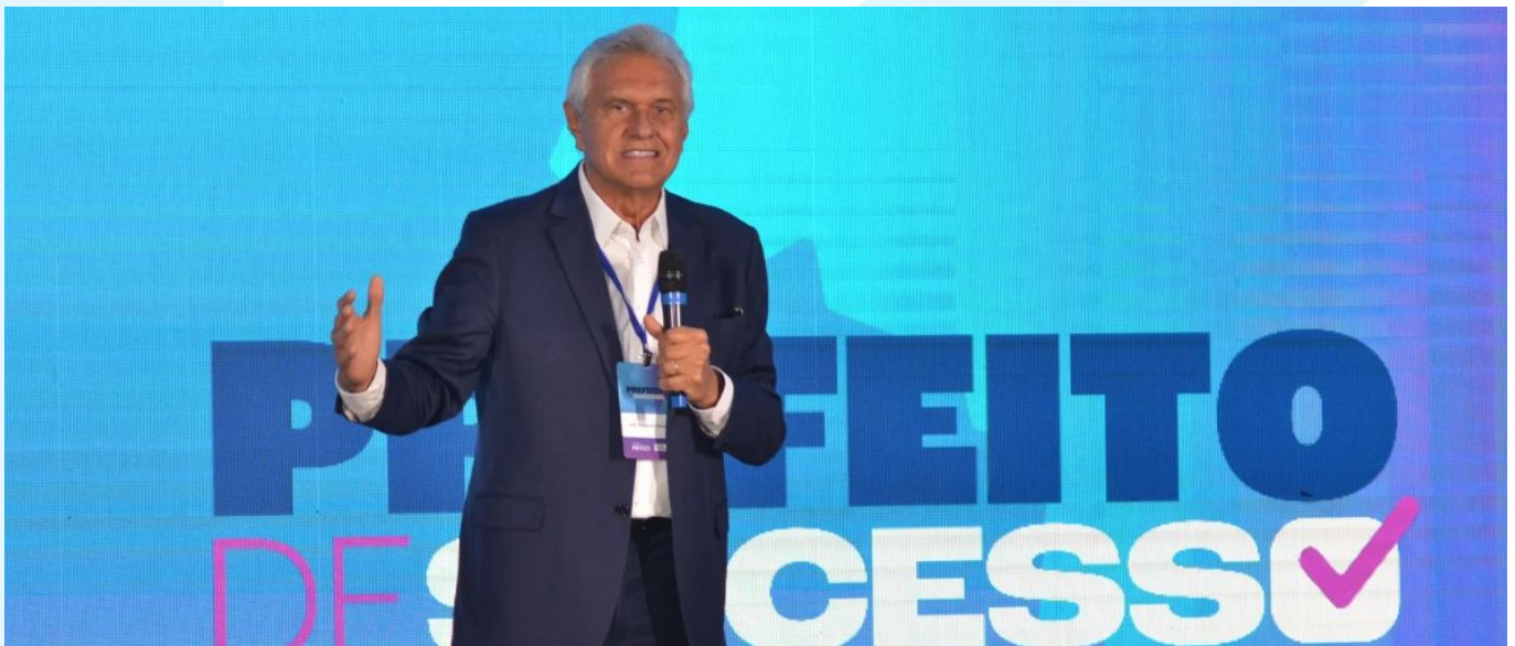
Ronaldo Caiado, governador de Goiás e presidente do Conselho Curador da Fundação Índigo, encerrou o evento com palestra sobre ações de seu governo

Outra etapa dessa jornada, que passou por formar candidatos e ajudá-los na elaboração de suas propostas, foi auxiliá-los em seus primeiros dias à frente de seus municípios. Para isso, realizamos um evento inédito em todo o país: o Prefeito de Sucesso. Em novembro, reunimos 150 prefeitos eleitos, em Brasília, para participarem de palestras e orientá-los sobre elaboração de um planejamento estratégico e prepará-los para os primeiros desafios de suas gestões.