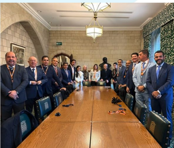
Visita da Índigo ao Parlamento inglês

Em mais uma iniciativa inédita, a Fundação Índigo deu início às suas missões internacionais. O projeto Índigo in London levou os 11 prefeitos das maiores cidades administradas por correligionários do União Brasil para conhecerem de perto o que há de mais moderno na gestão pública mundial. Foram cinco dias de palestras, reuniões e aprendizados na capital do Reino Unido.