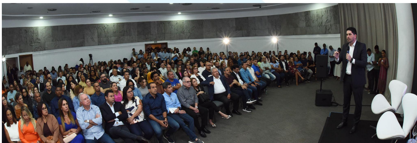
Lançamento do curso Melhores do Brasil, em Salvador (BA), com palestras sobre gestão pública

Cumprindo uma de nossas missões, que é revelar novos quadros para a política, realizamos o melhor curso de formação de jovens lideranças, em parceria com o Ibmec, a partir de maio. Foram mais de dois mil inscritos de todas as regiões do Brasil, que passaram por rigoroso processo seletivo para chegar aos 371 selecionados. Os alunos tiveram 120 horas/aula sobre conhecimentos aplicáveis à política e à gestão pública. Ao final do curso, apresentaram projetos com base em suas realidades para chegarem à nota final.