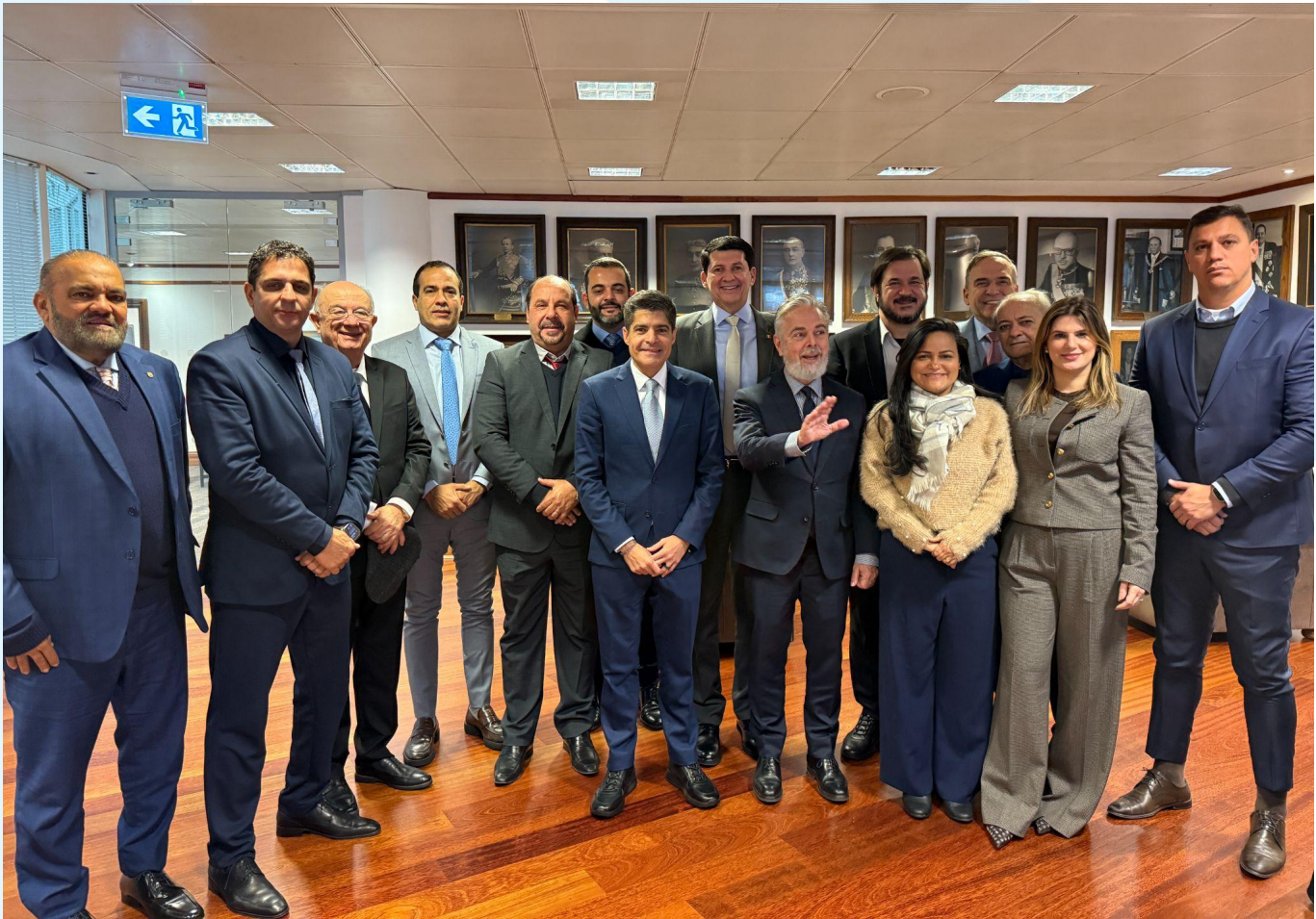
Os 11 prefeitos eleitos das maiores cidades governadas pelo União Brasil em Londres para cinco dias de conhecimento