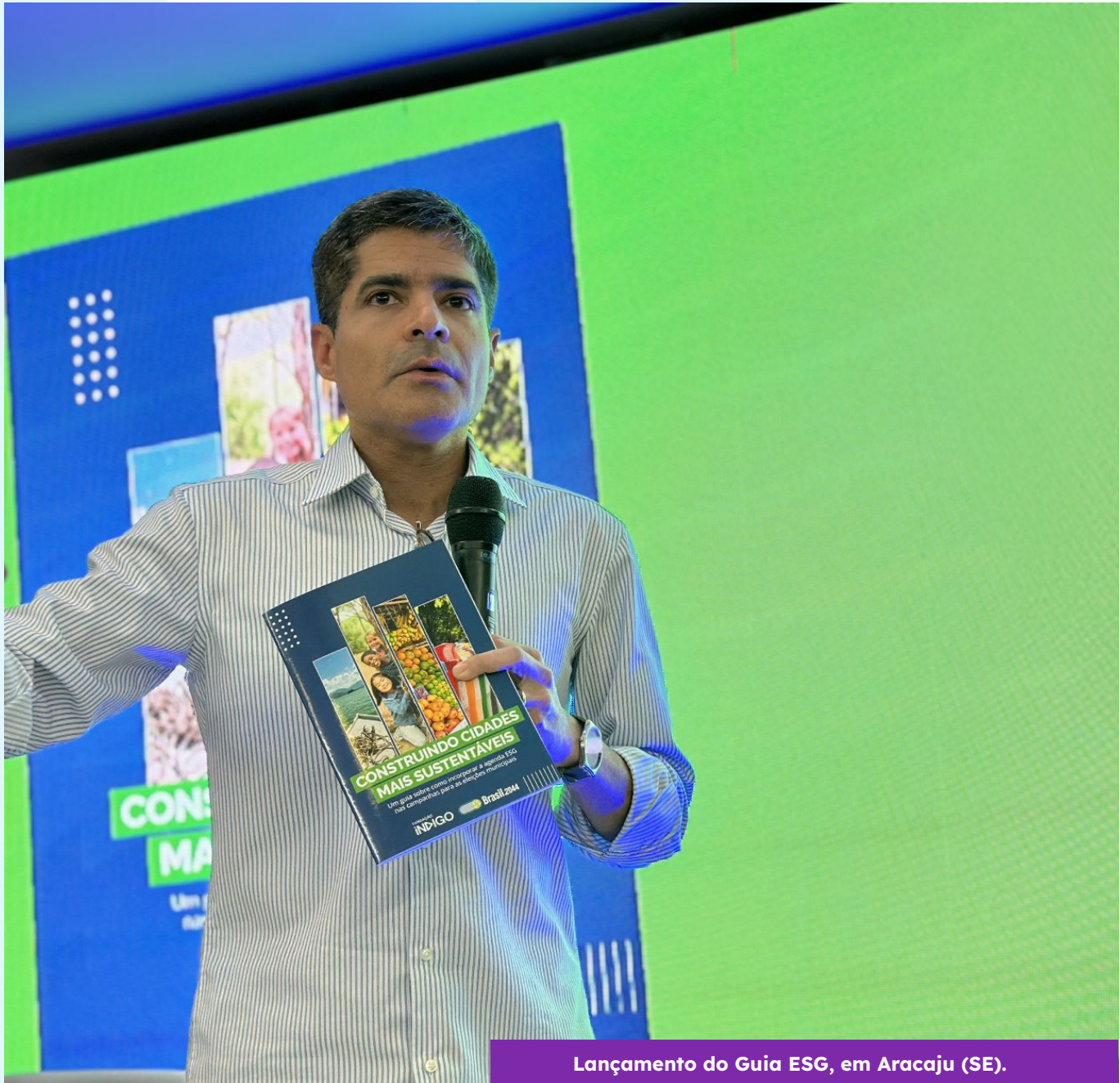
Lançamento do Guia ESG, em Aracaju (SE).

Além das orientações para montar um bom plano de governo, também entregamos a todos os candidatos do partido o Guia Construindo Cidades Mais Sustentáveis. Lançado em Aracaju (SE), o material aborda a pauta ESG, um dos temas mais discutidos em todo o mundo. O Guia também foi assinado pelo Brasil 2044, um hub de inovação do União Brasil, que visa a construção de políticas públicas para o desenvolvimento de cidades e comunidades mais sustentáveis.