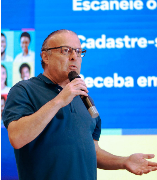
Paulinho Freire, prefeito de Natal, no lançamento do Guia

A continuidade desta trilha de conhecimento, que inicia com a formação de candidatos, é o Guia Como Montar um Plano de Governo. O documento, imprescindível para registro de candidaturas majoritárias municipais, é também uma peça fundamental para direcionamento das ações dos eventuais mandatos. Em parceria com a Consultoria Nossas Ideias, lançamos, em junho de 2024, o Guia em Natal (RN) e enviamos um exemplar para todos os pré-candidatos a prefeito e a vice-prefeito do União Brasil em todo o País.