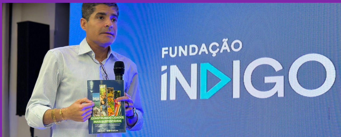
O presidente da Fundação Índigo, ACM Neto, no lançamento do Guia ESG em Aracaju (SE)

Lançado em Aracaju (SE), em agosto de 2024, o Guia foi distribuído para todos os candidatos do União Brasil a cargos executivos municipais, além de estar disponível em meio digital, pelo site da Índigo.