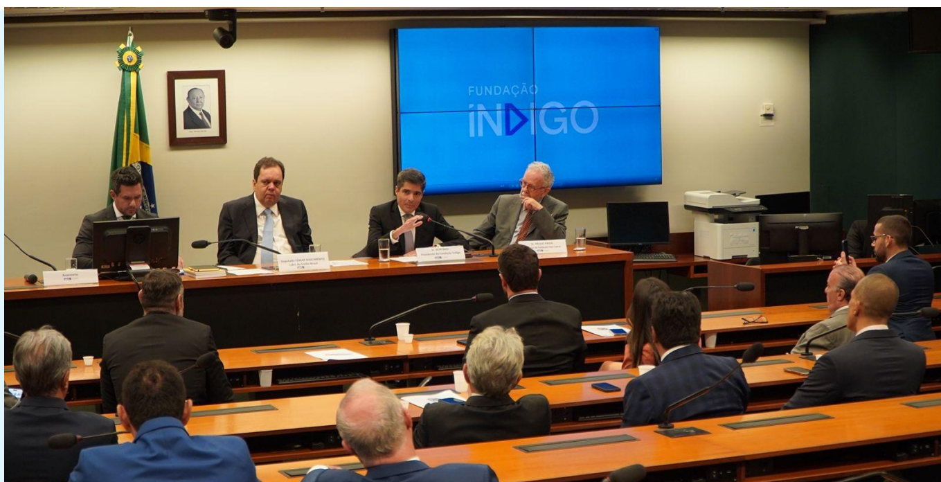
ACM Neto participa da reunião da bancada do União Brasil na Câmara dos Deputados

Também no eixo de Projetos Estratégicos, o fortalecimento com instituições de destaque nacional foi realizado nas parcerias entre organizações não governamentais como Todos Pela Educação, RenovaBR e Fundação Maria Cecilia Souto Vidigal . Esses acordos possibilitaram maior nível de informação de políticos do União Brasil e suas equipes acerca de temas como educação e primeira infância.